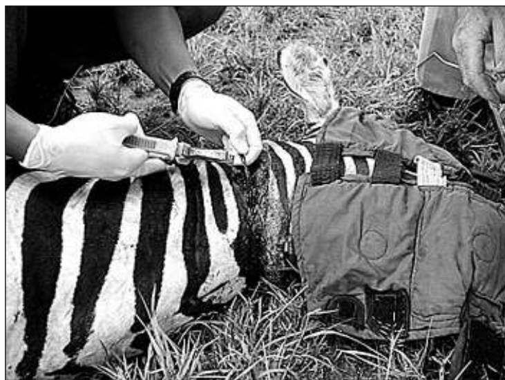
● Parkwachters in het Nationaal Park Serengeti in Tanzania verwijderen een door stroopers geplaatste strik waarin een zebra is gevangen.

Wat is de beste methode om wilde dieren in Afrika te beschermen? Wetenschappers discussiëren er al jaren over, maar tot op heden slaan ze er niet in op deze vraag om een eenduidig antwoord te geven.