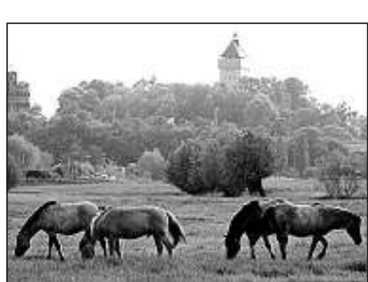
Koniks in de Nijmeegse Stadsward.

Hollandse Natuurdag in de Aristozalen, Teleportboulevard 100, Amsterdam-Sloterdijk. ▶ t/m 13: foto-expositie "Camera natura" in bezoekerscentrum van Het Nationale Park De Hoge Veluwe. ▶ 16: 10.00 uur, langeafstandsnertwandeling (18 km, incl. snert) met de boswachter, omgeving van het Woold, ten zuiden van Winterswijk. Start: kaasboerderij Harminahoeve aan de Kulverweg. Meer informatie: www.mooigelderland.nl en 06-53777594 (wo. t/m za. 9.30-10.00 uur). ▶ 4, 6 januari. 21, 23 februari: 12.30 uur, snertvaartocht met fluisterboot in de Biesbosch. Start: Biesboschcentrum Dordrecht, Baanhoekweg 53 in Dordrecht. Reservieren: 078-6305353 en info@biesbosch.org . ▶ t/m 18 maart 2007: tentoonstelling "Struinen in de Stadsward" in Natuurmuseum Nijmegen, Gerard Noodtstraat 121. Meer informatie: www.natuurmuseum.nl .