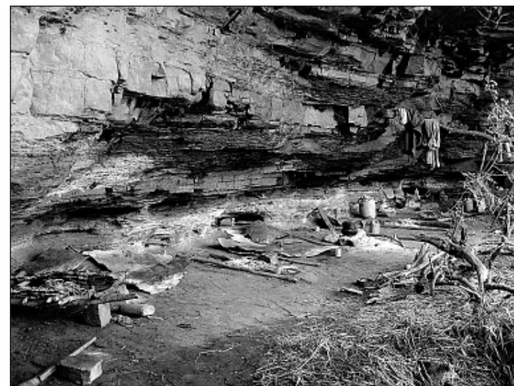
● Een basiskamp van stroopers in Nationaal Park Serengeti. Vlees en huiden lagen er te drogen toen het werd ontdekt.

tal zeldzame diersoorten betreft – en bepleiten juist rigoureuze bescherming van de wilde fauna. Hun advies luidt: bied de bevolking alternatief werk, zodat ze het wild met rust laten. En neem maatregelen voor het geval ze dat toch niet doen: zet een hek om het leefgebied van het wild, rust parkwachters uit met een jachtgeweer – niet om wild te schieten, maar om stroopers op afstand te houden. Aanhangers van de laatste benadering kregen er sinds eind vorige maand een steunbetuiging bij in de vorm van een onderzoeksrapport van Canadese en Tanzaniaanse wetenschappers in het wetenschappelijk tijdschrift Science. In hun studie relateren ze het aan-