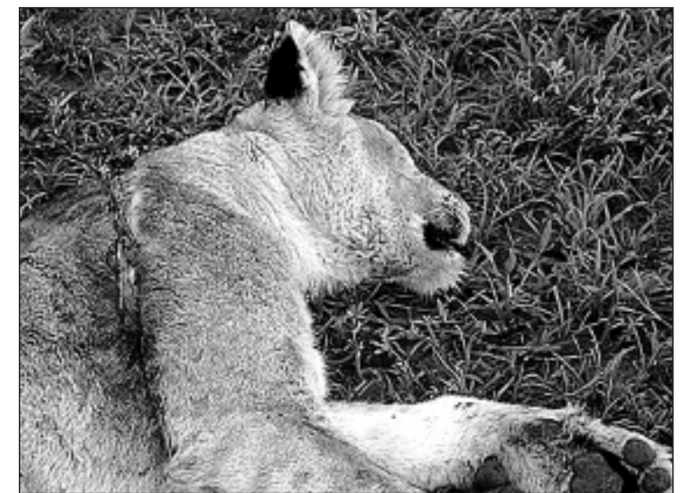
● Een leeuw is verdoofd door een dierenarts, zodat een strik kan worden verwijderd.

Eind jaren tachtig trekt de Tanzaniaanse economie weer aan en