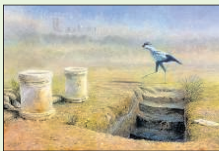
● "No Time to Lose", olieverf op paneel, door Ulco Glimmerveen.

Vaag op de achtergrond zijn de Twin Towers zichtbaar, maar verder doet het schilderij aan een oosters woestijnlandschap denken. Een secretarisvogel maakt zich snel uit de voeten. Drie schijnbaar onverenigbare zaken. "No Time to Lose" (geen tijd te verliezen), de inzending van Ulco Glimmerveen voor Birds in Art 2005, staat bol van symboliek. Enige kennis van het gedrag van de langpotige Sagittarius serpentarius is vereist om het verband met de terreuraanslag in New York te leggen. „Het dier jaagt op prooi en in open droge gebieden en is heel capabel in het doden van slangen en ratten.” De uitleg verraadt de interesse van