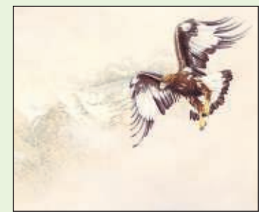
● "De eerste vlucht (jonge steenaarend)", aquarel, Renso Tamse.

De Rotterdammer maakt aquarellen, waarbij hij de waterverf zo