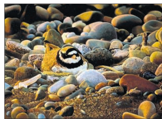
● "Eventide" (bontbekplevier).