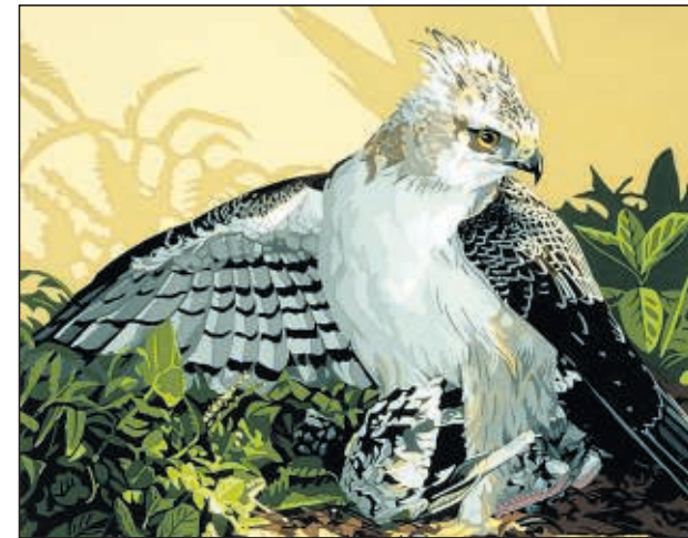
● "This is my chicken" (spitskuifarend).